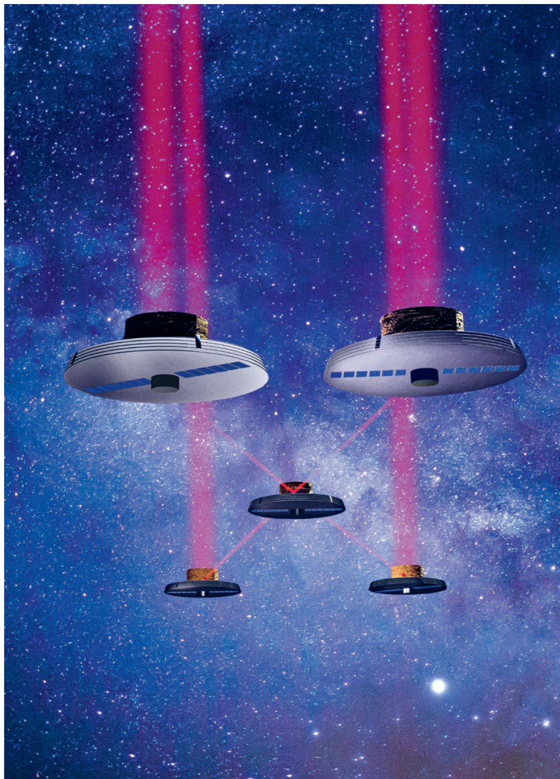
Visualisierung des Weltraumteleskops Life, das Infrarotlicht von der Atmosphäre von Exoplaneten empfangen und analysieren soll.

Nachhaltige Ernährungssysteme, künstliche Intelligenz, Förderung von Studierenden, Unternehmerinnen und Forschern: Ihre Unterstützung brachte 2022 wichtige Themen an der ETH voran.