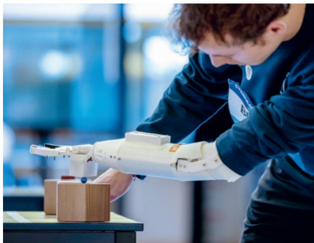
Der CYBATHLON will die Gleichstellung von Menschen mit Behinderungen auf allen Ebenen vorantreiben.